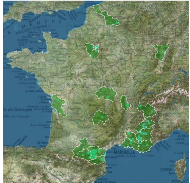
Figure 1: Répartition dans le territoire France métropolitaine pour l'espèce Helix lucorum Linnaeus, 1758 mise à jour en novembre 2015 (Source: Muséum national d'Histoire naturelle [Ed.], 2003-2015).

prospéction pour cette espèce. Le suivi d' Helix lucorum sur ces nouveaux foyers d'introduction permettrait de suivre son extension et de connaître ses modalités de dispersion. Enfin un besoin de prospections supplémentaires s'avère nécessaire pour préciser la répartition de l'espèce sur le territoire national.